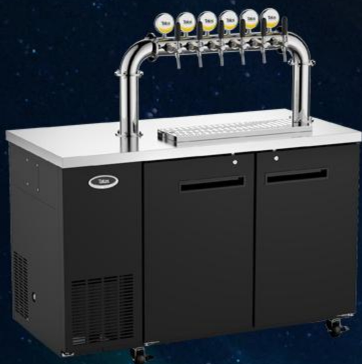
移动双冷、冷柜一体机