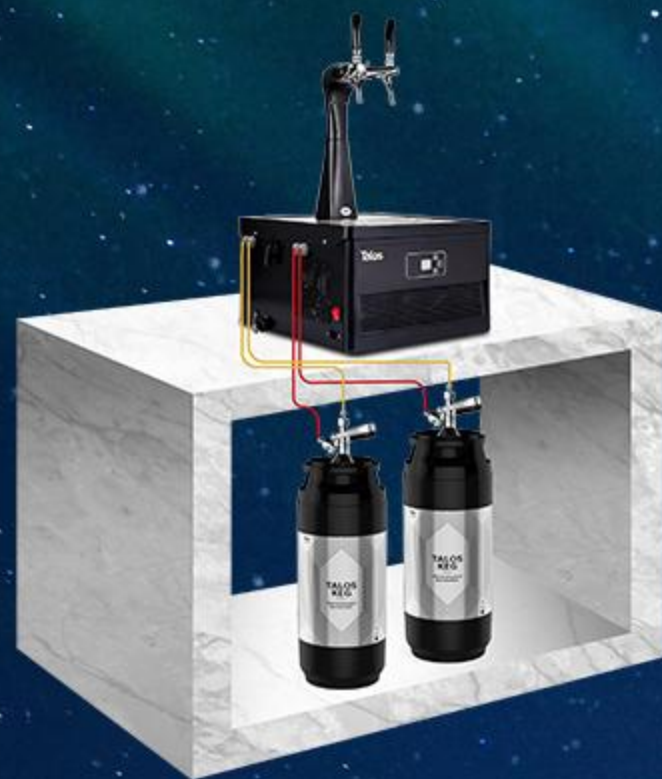
分体式桌面水冷机