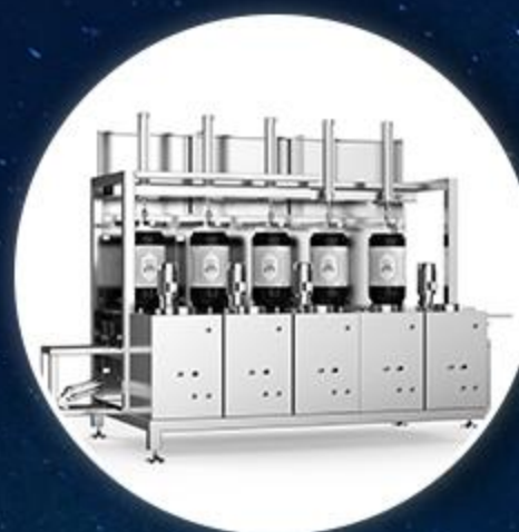
大桶多工位灌装机